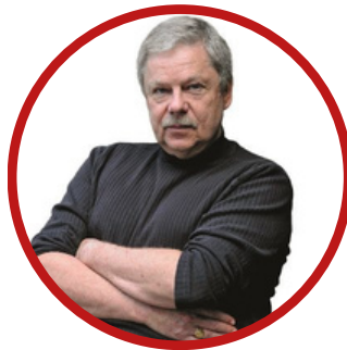
Xavier Raufer Criminologue

La radiographie criminelle de la France incombera donc à RÉEL CRIMINEL, dont la base documentaire accumule chaque mois des milliers de faits et données tous sourcés et recoupés avec soin. Sa mission : d'ici l'élection présidentielle (2027 par hypothèse), divulguer la réalité criminelle aux publics intéressés.